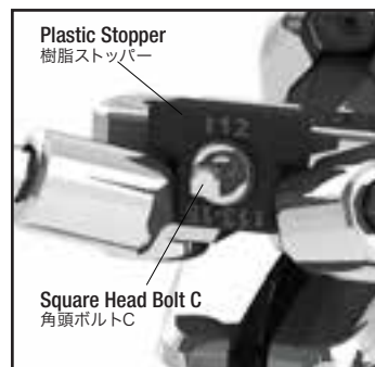
Fig.3 / 図3