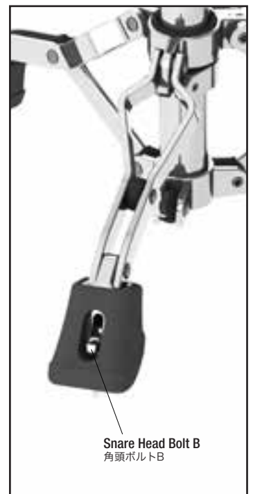
Fig.2 / 図2