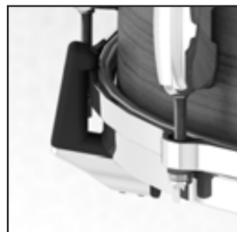
Fig.1 / 図1

本製品は12"から15"口径のスネアドラムに使用できますが、12"スネアドラムをご使用の際にはバスケットアームの開口角度の調整が必要になります。角頭ボルトCをチューニングキーで緩めて、「↑12"」の表記が上にくるように樹脂ストッパーを回転させ、角頭ボルトCを締めて固定します。(図3)