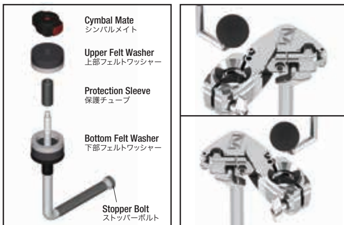
Fig.1 / 図1