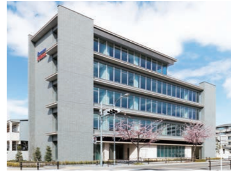
星野楽器株式会社 本社ビル

設立 1981年(昭和56年) [創業1908年(明治41年)] 資本金 4,500万円 代表者 取締役社長 星野公秀 従業員数 155名 事業内容 弦楽器・打楽器・電子楽器の企画設計・開発業務及び輸出入業務、海外市場開拓、海外卸販売、打楽器及び付属品の製造 事業所 愛知県名古屋市東区榑木町3-22 主要取引銀行 三菱UFJ銀行、みずほ銀行 年間売上高 188億53百万円(2023年10月期)