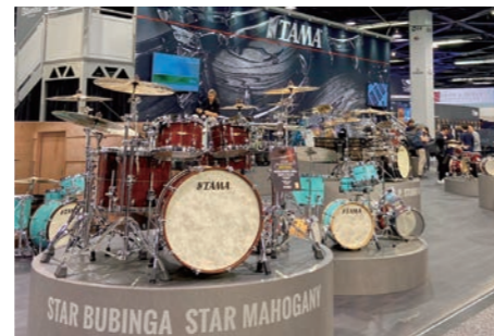
ショウプースの展示