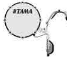
16" Bass drum

バスドラム用のサポートバーは口径によってセッティングを変えることで、より理想的なポジションに設定することができます。 サポートバーの向きを変えることによって、大口径で低くセッティングした際にサポートバーが足に接触することがありません。